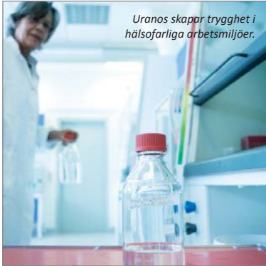
Uranos skapar trygghet i hälsofarliga arbetsmiljöer.