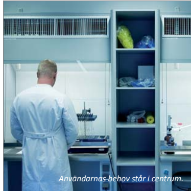
Användarnas behov står i centrum.