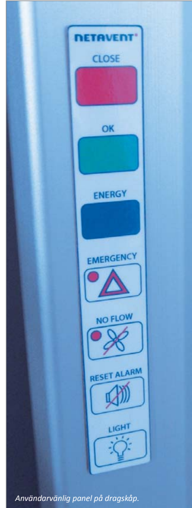
Användarvänlig panel på dragskåp.